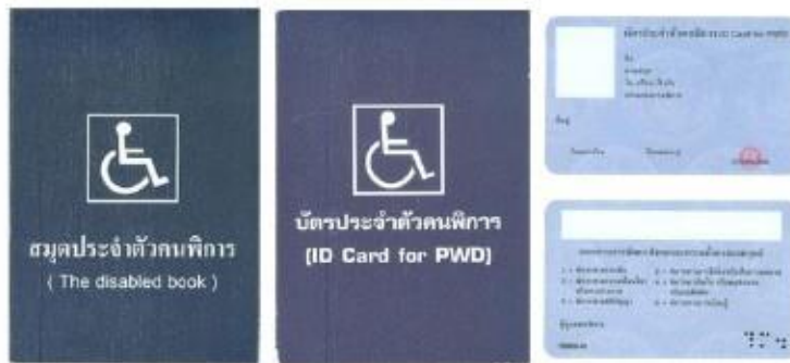
ตัวอย่างบัตรและสมุดประจำตัวคนพิการ

* กรณีได้รับเบี้ยยังชีพคนพิการอยู่แล้วและได้ย้ายเข้ามาในพื้นที่ตำบลบ้านเชียงจะต้องมาขึ้นทะเบียนที่องค์การบริหารส่วนตำบลบ้านเชียงอีกครั้งหนึ่ง